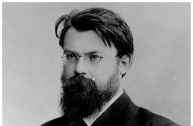
Вернадский В.И. (1863-1945)