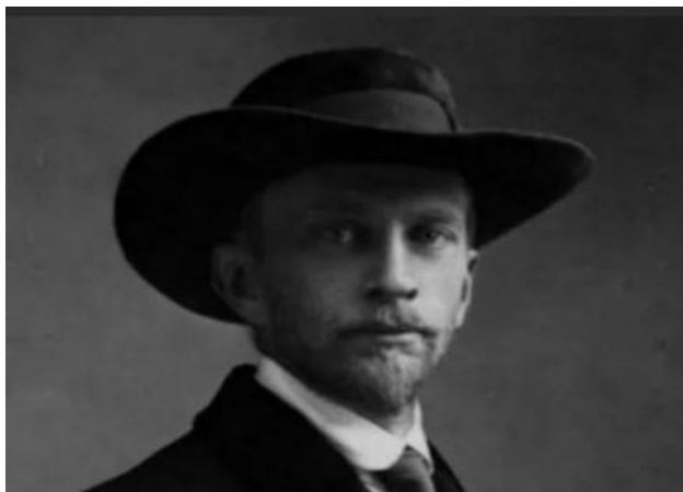
Ильин И.А. (1883-1954)