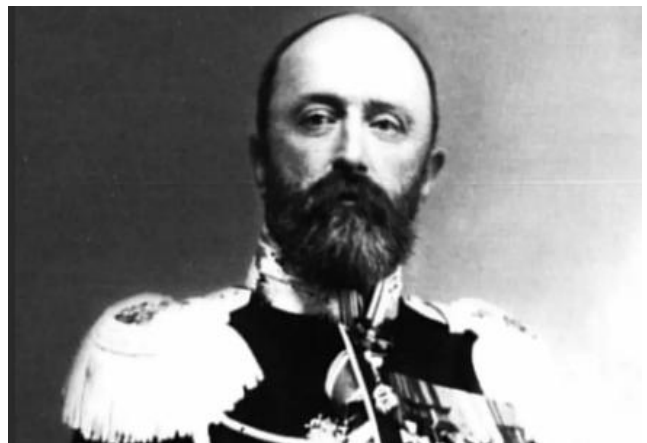
Руднев В.Ф. (1855–1913)