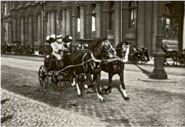
Прогулка по Дворцовой набережной. Петербург, 1905 г.