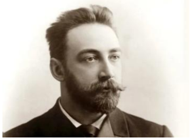
Лебедев С.В. (1874–1934)