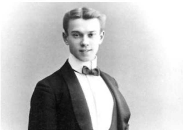
Нижинский В.Ф. (1889-1950)