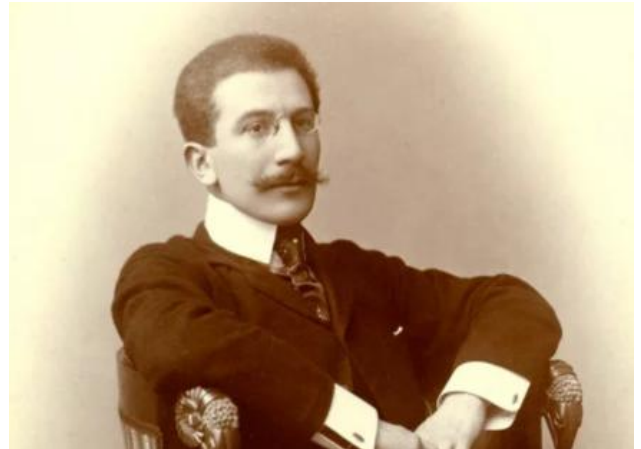
Бакст Л.С. (1866–1924)