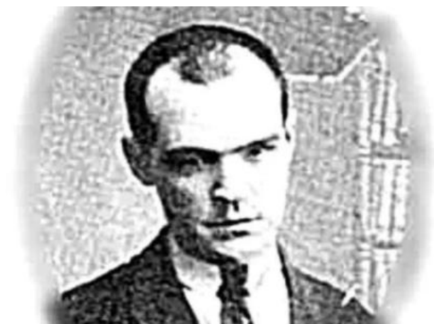
Филонов П.Н. (1883-1941)