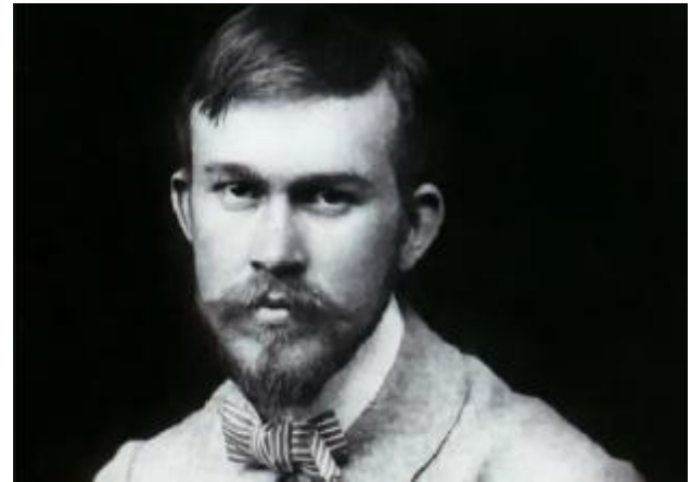
Кустодиев Б.М. (1878-1927)