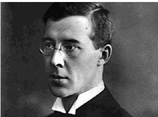
Сорокин Питирим (1889-1968)