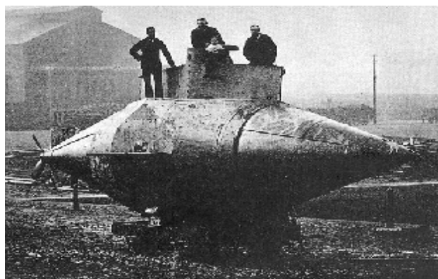
Подводная лодка «Порт-Артурец». Была изготовлена в Порт-Артуре