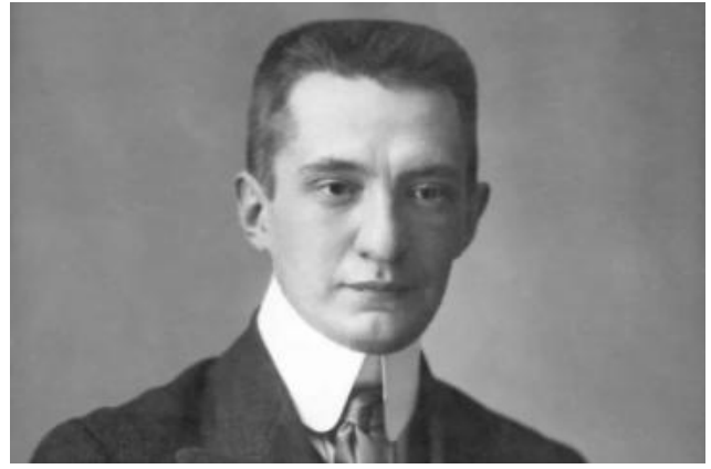
Керенский А.Ф. (1881–1970)