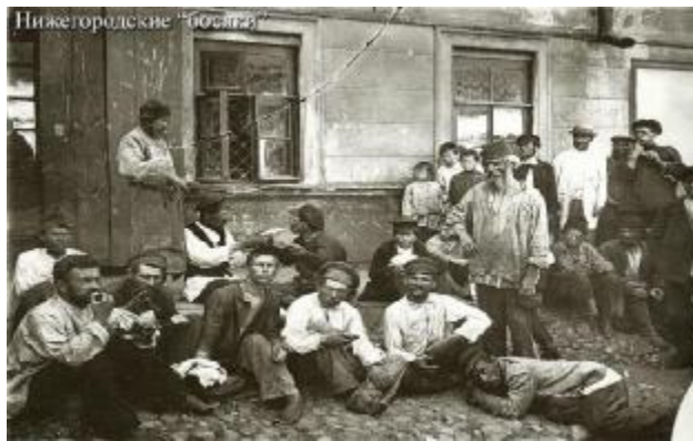
Нижегородские «босяки». Фото начала XX в.