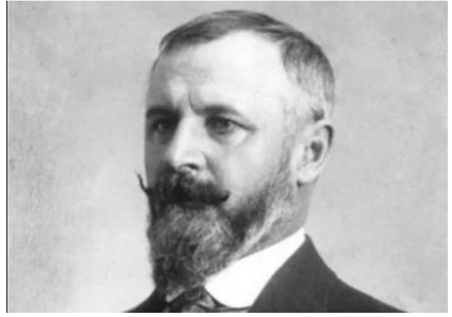
Коровин К.А. (1861-1939)