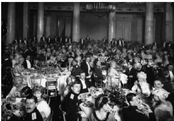
Розовый бал у графини Шуваловой, 1914 г.