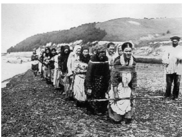
Женщины-бурлаки. Фото начала XX в.