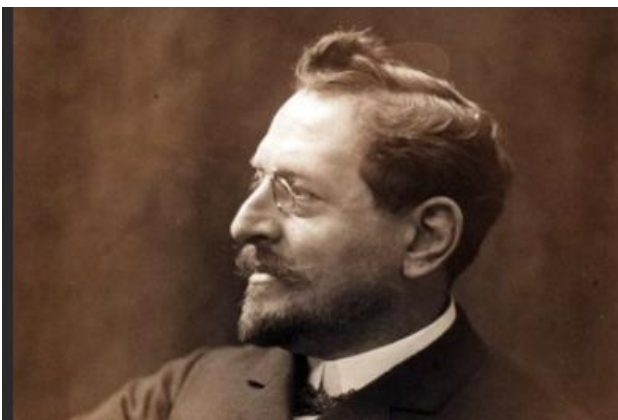
Прокудин-Горский С.М. (1863–1944)