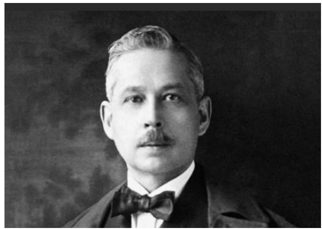
Сомов К.А. (1869-1939)