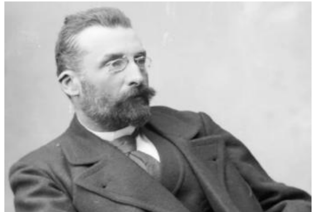
Бенуа А.Н. (1870–1960)