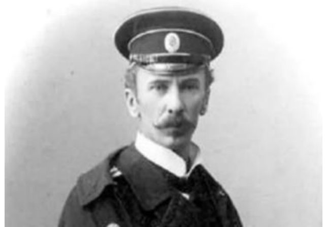
Шмидт П.П. (1867-1906)