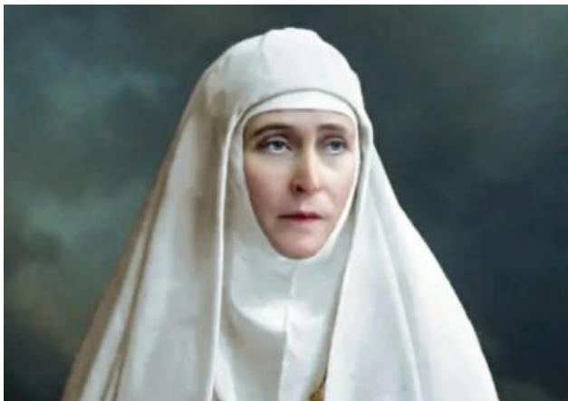
Великая княгиня Елизавета Фёдоровна (1864–1918)