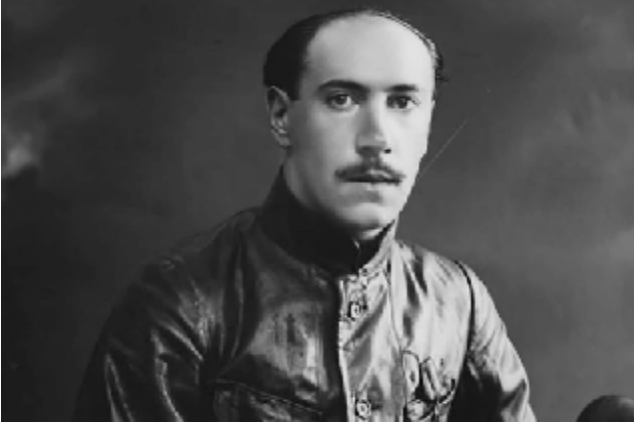
Сикорский И.И. (1889-1972)