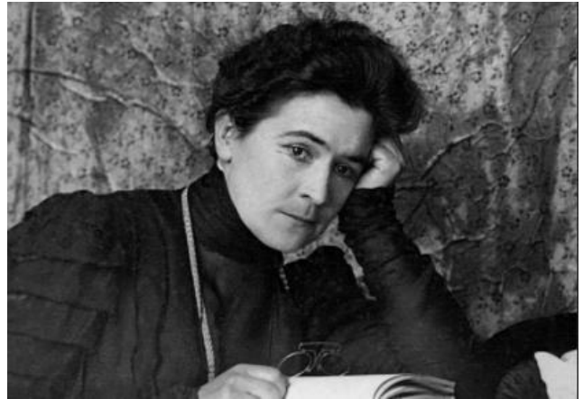
Книппер-Чехова О.Л. (1868–1959)