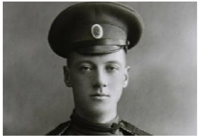
Гумилев Н.С. (1886–1921)