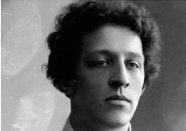
Блок А.А. (1880-1921)