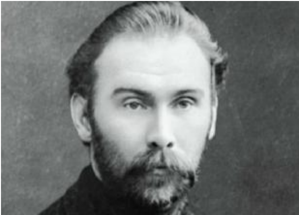
Клюев Н.А. (1884–1937)