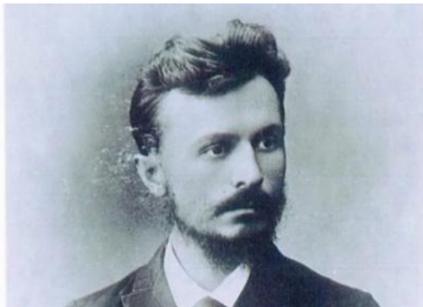
Булгаков С.Н. (1871-1944)