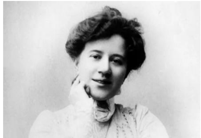
Щепкина-Куперник Т.Л. (1874-1952)