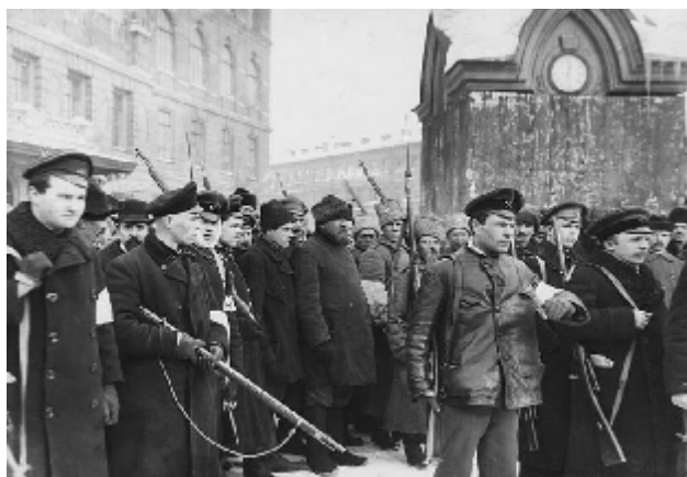
Февраль 1917 г. Арест и конвоирование переодетых городских. Петроград.