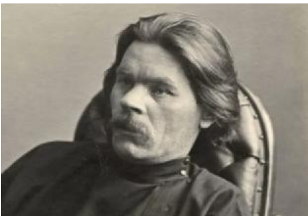
Горький А.М. (1868–1936)