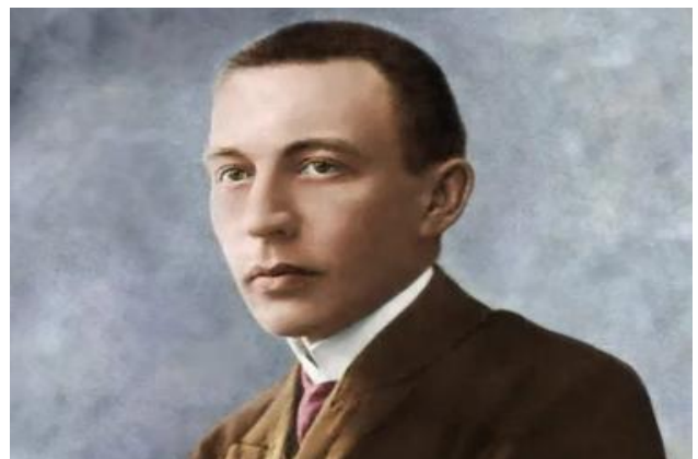
Рахманинов С.В. (1873–1943)