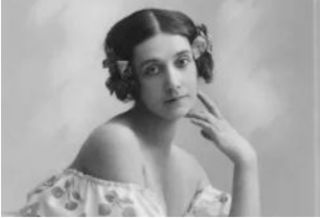
Карсавина Т.П. (1885–1978)