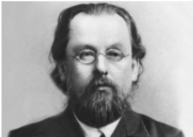
Циолковский К.Э. (1857–1935)