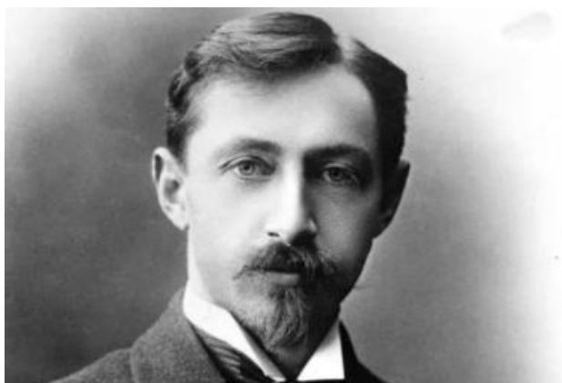
Бунин И.А. (1870-1953)