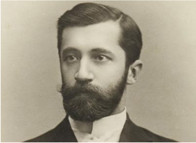
Мережковский Д.С. (1865-1941)