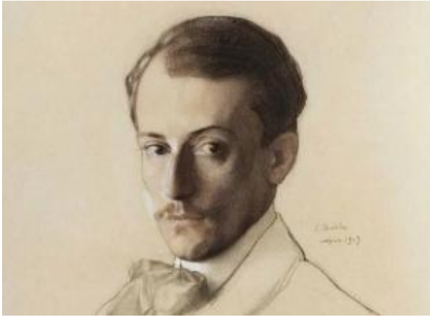
Лансере Е.Е. (1875–1946)