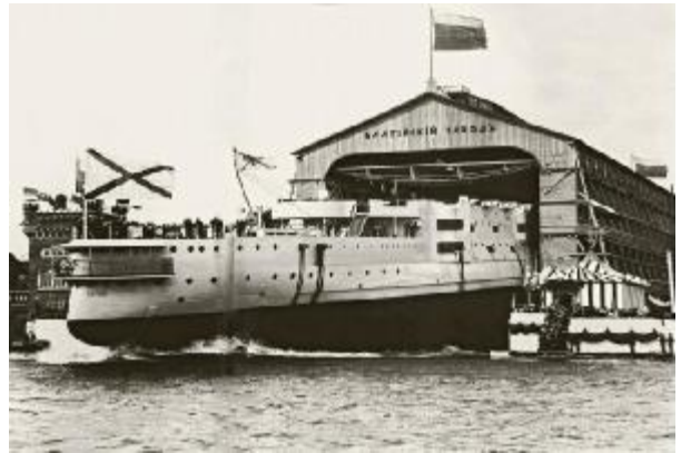
Спуск на воду эскадренного броненосца «Победа» со стапеля Балтийского судостроительного завода, 1911 г.