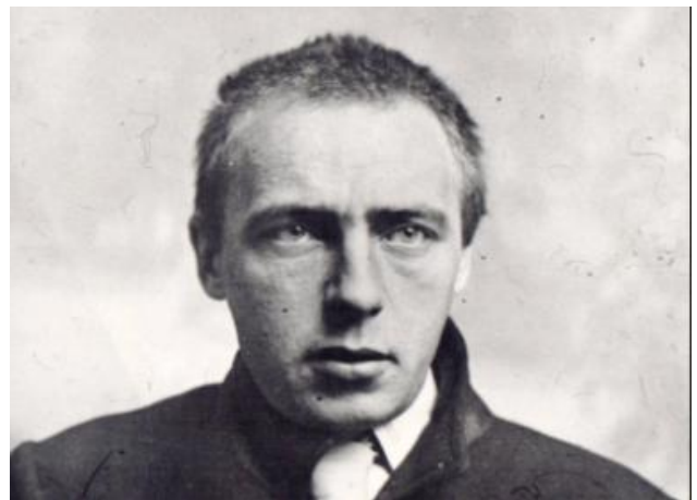
Хлебников Велимир (1885-1922)