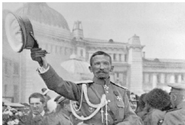
Л.Г. Корнилов в дни работы Государст- венного совещания в Москве. Август, 1917 г.