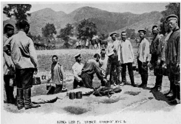
Русские солдаты варят щи в полевой походной кухне. Маньчжурия, 1904 г.