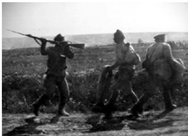
Разложение в Русской армии. Солдаты дезертируют. Июль, 1917 г.