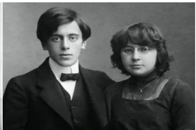
Эфрон С.Я. (1893-1941), Цветаева М.И. (1892-1941)