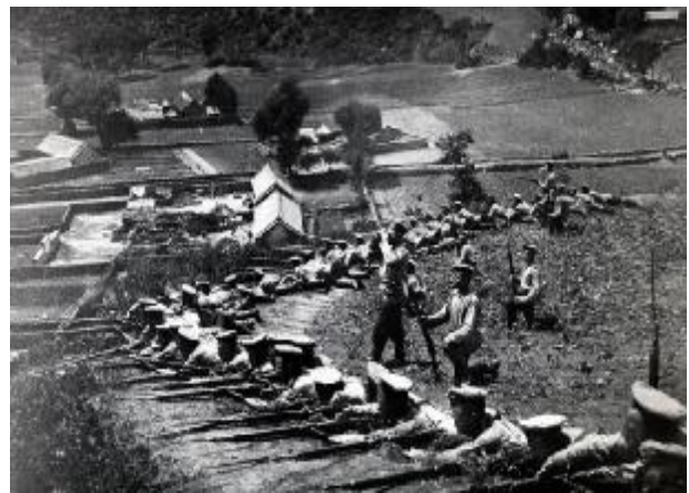
Русские залегли на оборонительных рубежах Порт-Артура. 1904 г.