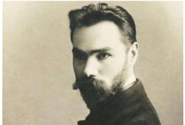
Брюсов В.Я. (1873-1924)