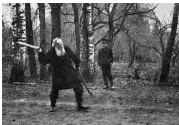
Л.Н. Толстой играет в «городки». Ясная Поляна, 1909 г.