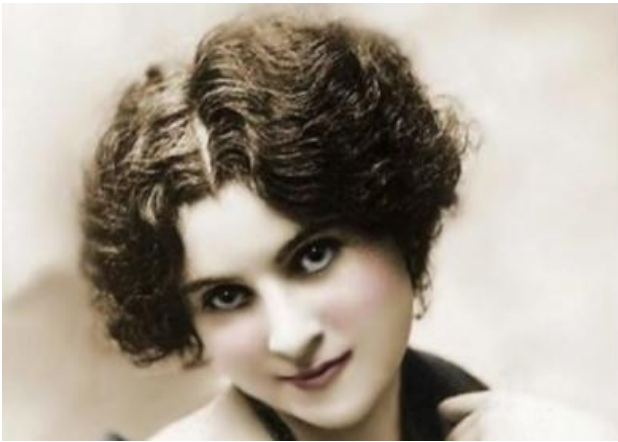
Плевицкая Н.В. (1884–1940)