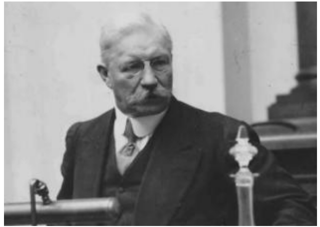
Милюков П.Н. (1859-1943)