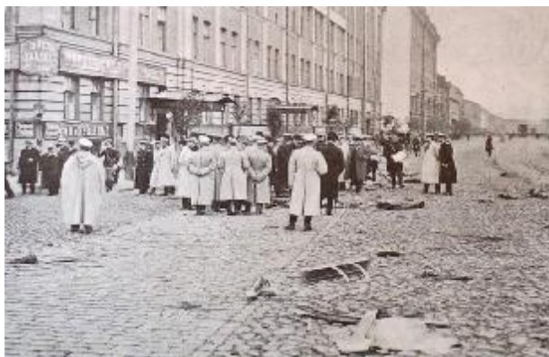
Следственная комиссия с министром юстиции Н.В. Муравьевым на месте убийства министра МВД В.К. Плеве. 28 июля 1904 г.