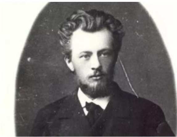
Шухов В.Г. (1853-1939)