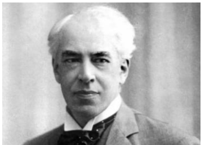
Станиславский К.С. (1863-1938)