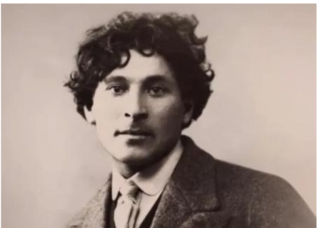
Шагал М.З. (1887–1985)