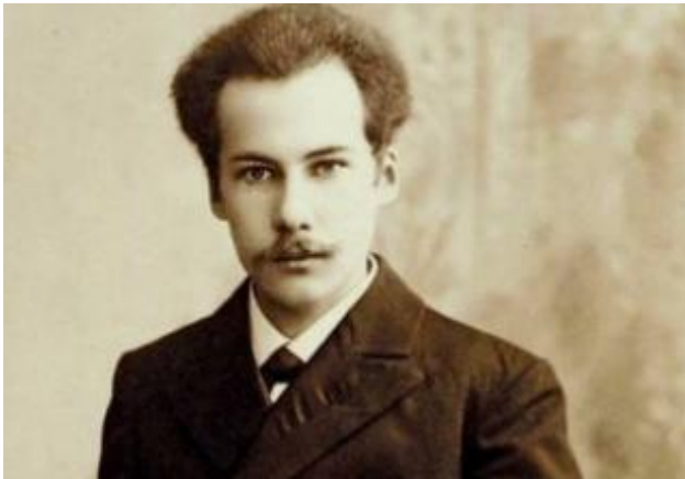
Белый Андрей (1880–1934)