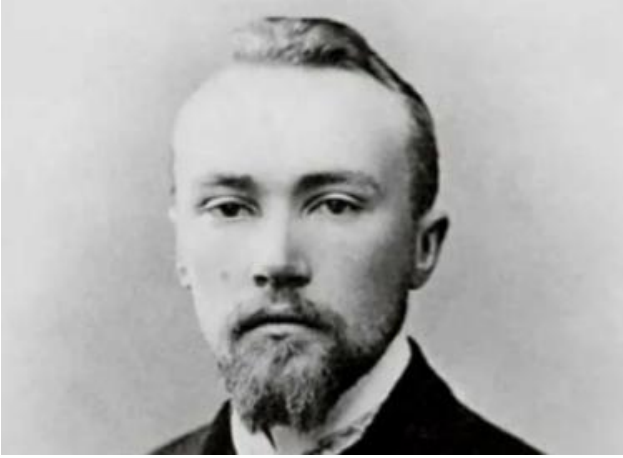
Рерих Н.К. (1874–1947)