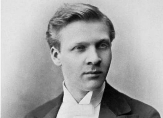
Шаляпин Ф.И. (1873-1938)