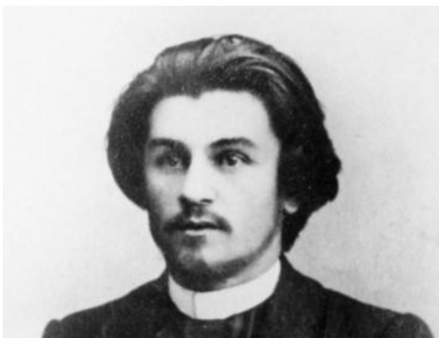
Малевич К.С. (1879–1935)