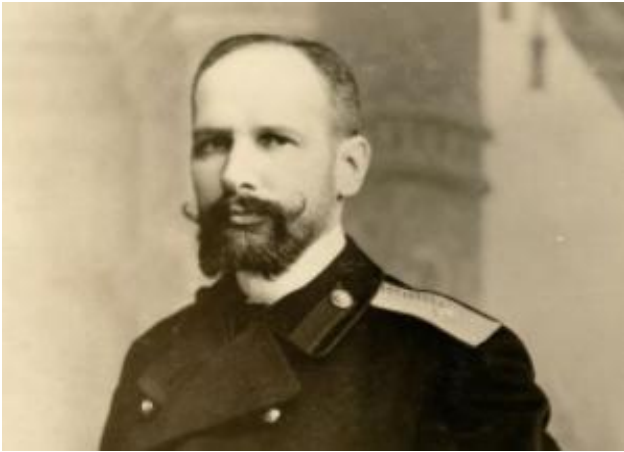
Столыпин П.А. (1862-1911)