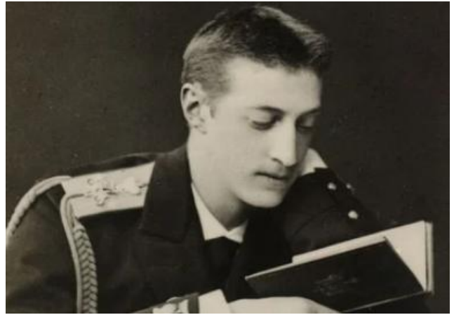
Великий князь Константин Константинович (1858–1915)