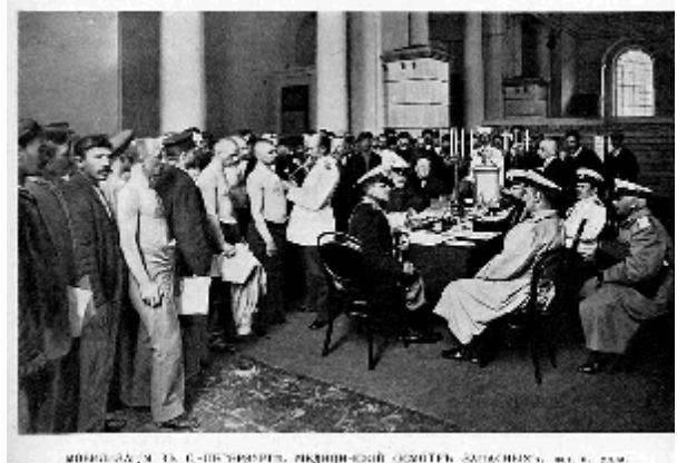
Мобилизация в Петербурге. Медицинский осмотр запасных.