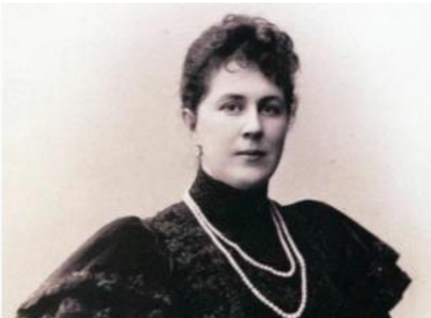
Тенишева М.К. (1858-1928)