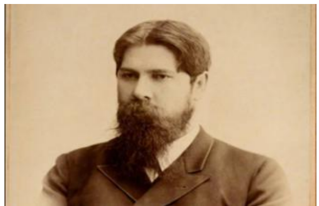
Бехтерев В.М. (1857–1927)