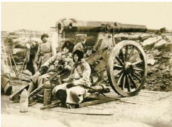
Русские солдаты у артиллерийского орудия. 1904 г.