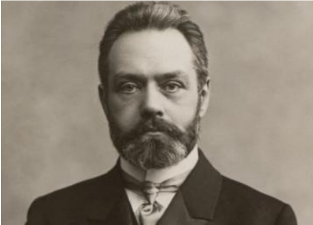
Гучков А.И. (1862-1936)