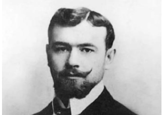
Ханжонков А.А. (1877–1945)