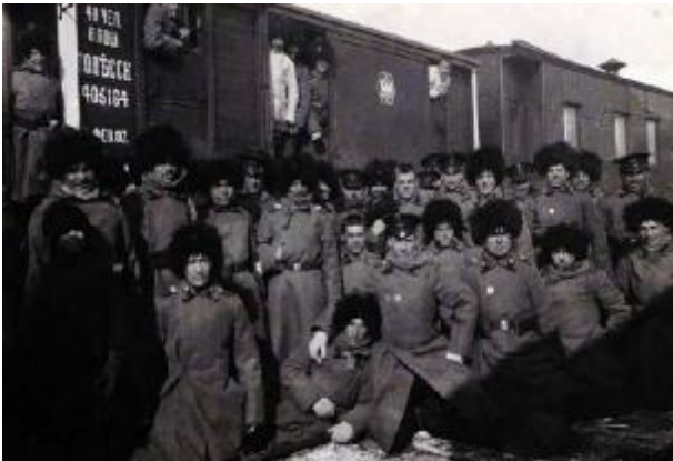
Переброска войск из Иркутска в Маньчжурию. 1904 г.