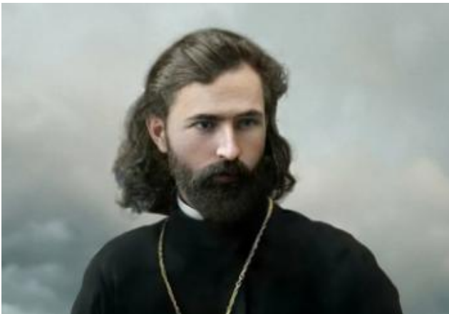
Гапон Г.А. (1870–1906)