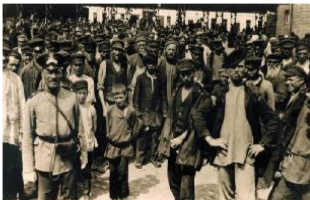
Хитрованцы – обитатели Хитровского рынка в Москве – самого криминогенного места в царской России