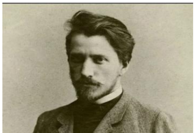
Серов В.А. (1865–1911)