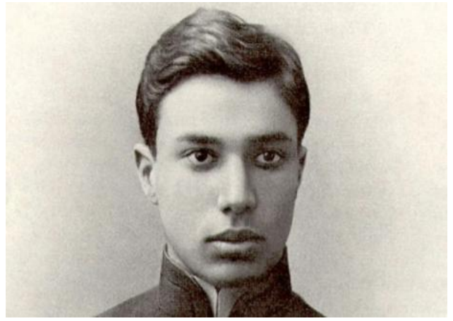
Пастернак Б.Л. (1890–1960)