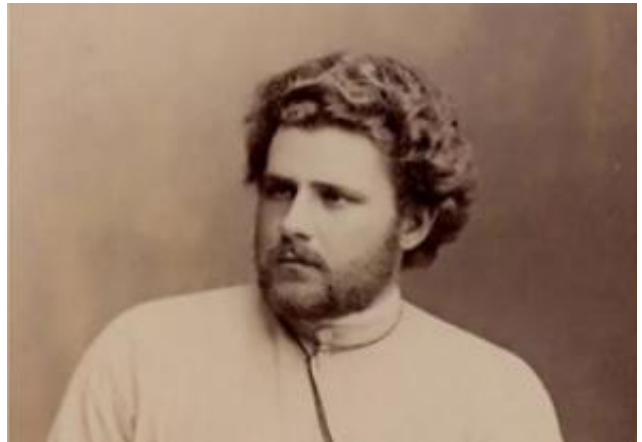
Волошин М.А. (1877–1932)