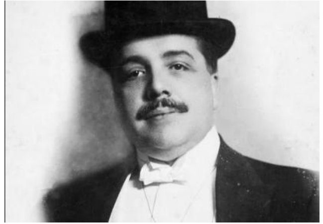
Дягилев С.П. (1872-1929)