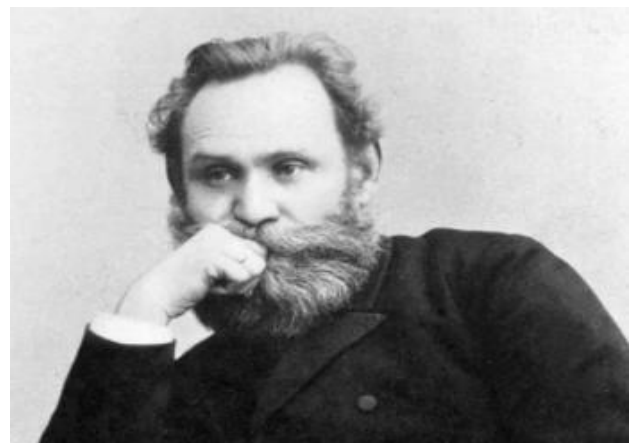
Павлов И.П. (1849-1936)