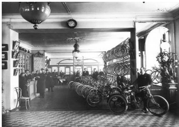
1912 г. Продажа велосипедов. Торговый дом «Победа», Петербург