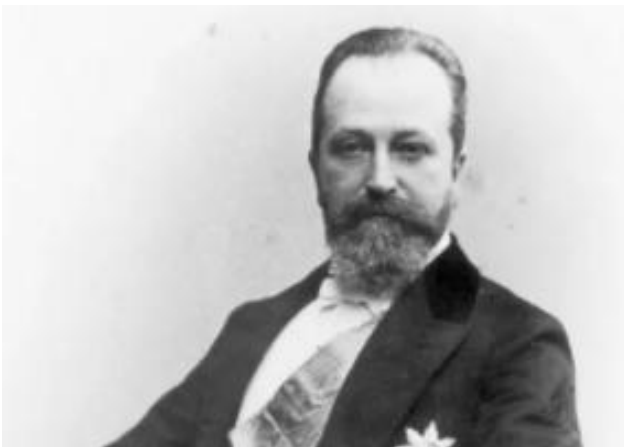
Коковцов В.Н. (1853–1943)