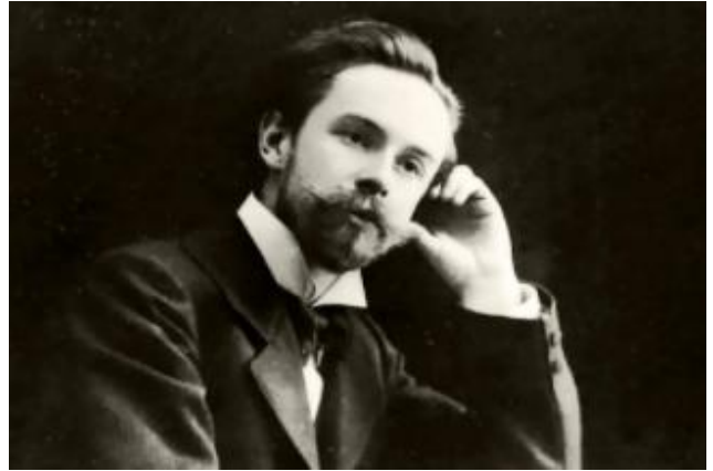
Скрябин А.Н. (1872-1915)