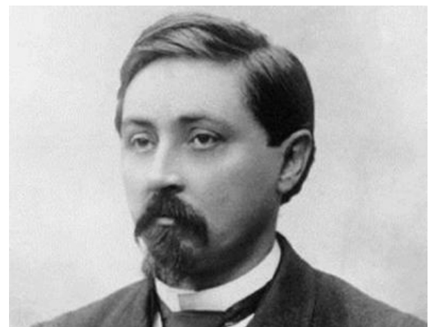
Мамин-Сибиряк Д.Н. (1852–1912)