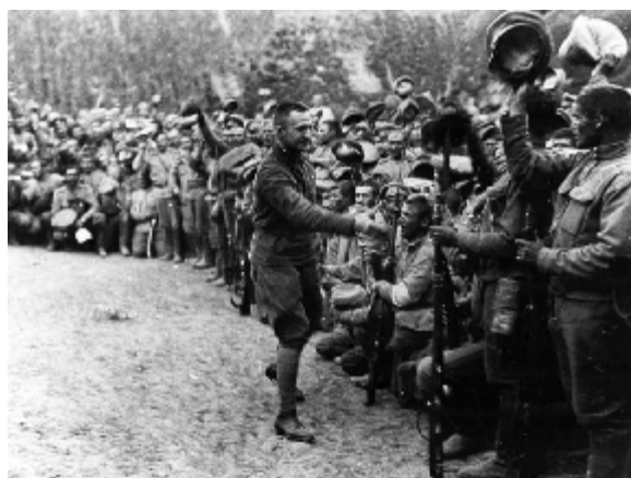
А.Ф. Керенский воодушевляет солдат перед июньским наступлением на Юго- Западном фронте