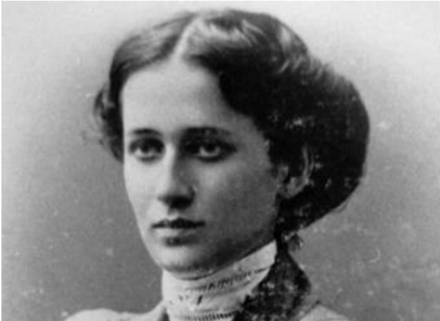
Ахматова А.А. (1889–1966)