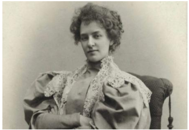
Гиппиус З.Н. (1869–1945)