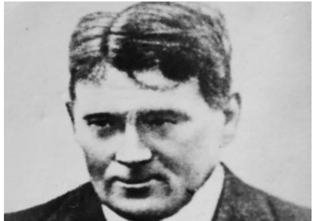
Уточкин С.И. (1876-1916)