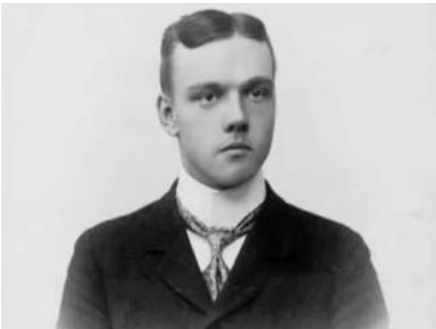
Лидваль П.И. (1882–1963)