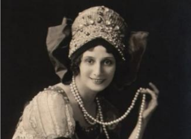
Павлова А.П. (1881–1931)