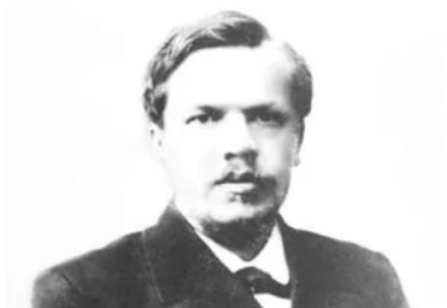
Чаплыгин С.А. (1869–1942)