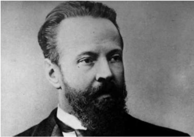
Витте С.Ю. (1849–1915)