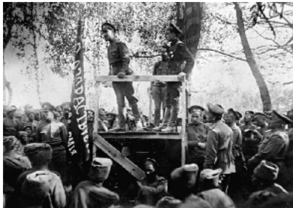
Комиссар Временного правитель- ства выступает перед фронтовиками с призывом к войне до победного конца. Июнь, 1917 г.