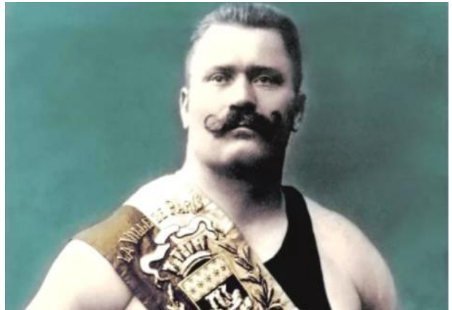
Поддубный И.М. (1871–1949)