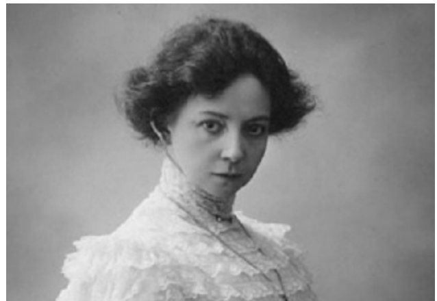
Комиссаржевская В.Ф. (1864–1910)