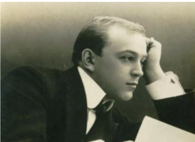
Собинов Л.В. (1872-1934)