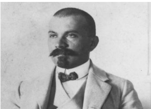
Щусев А.В. (1873-1949)