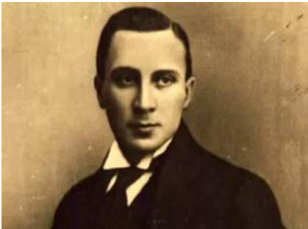
Мозжухин И.И. (1889-1939)