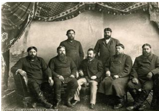
Группа нижегородских купцов. Фото начала XX в.