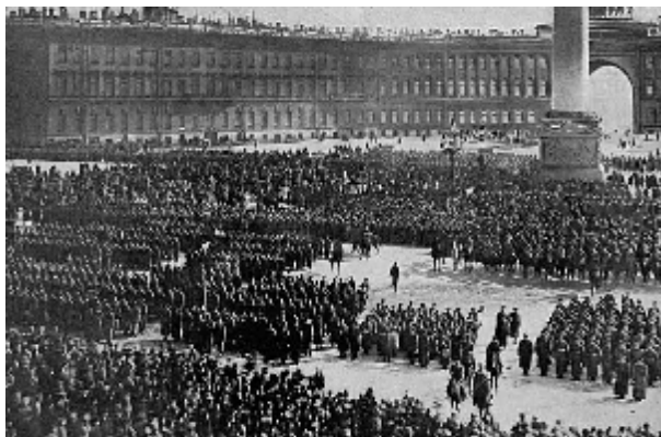
Присяга Временному правительству войск Петроградского гарнизона, ап- рель, 1917 г.