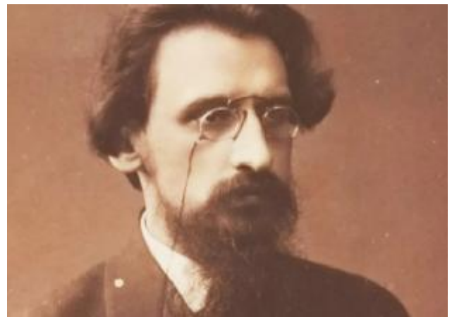
Карсавин Л.П. (1882-1952)