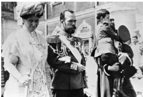
Николай II с дочерьми Ольгой, Татьяной, Марией и сыном Алексеем выходят из Федоровского собора (Царское Село), 1913 г.