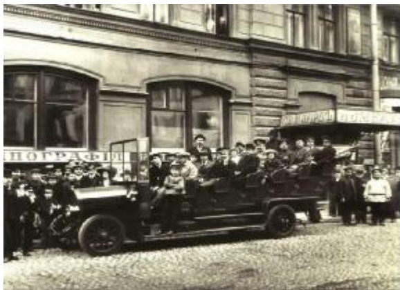
Многоместный автобус в Петербурге, 1911 г.