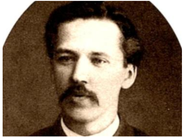
Зубатов С.В. (1864-1917)