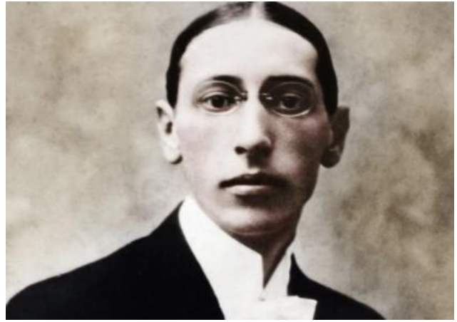
Стравинский И.Ф. (1882-1971)