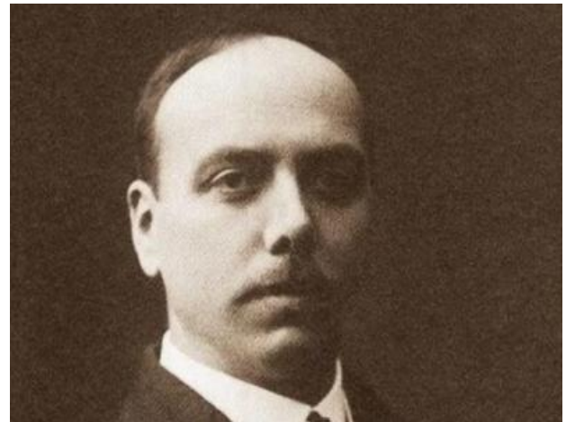
Лидваль Ф.И. (1870–1945)