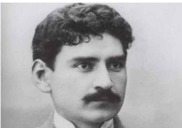
Сарьян М.С. (1880–1972)