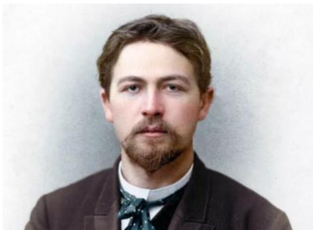
Чехов А.П. (1860–1904)