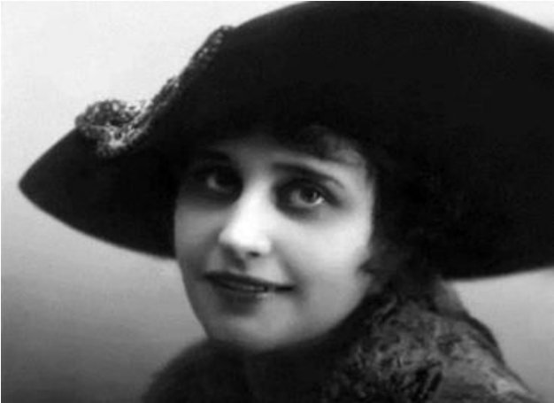
Холодная Вера (1893–1919)