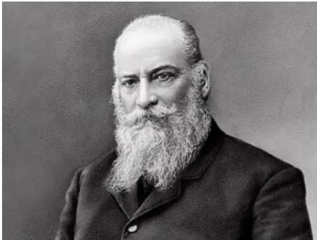
Жуковский Н.Е. (1847-1921)