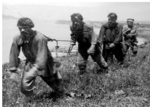
Мужчины-бурлаки. Сезонные работы на Волге