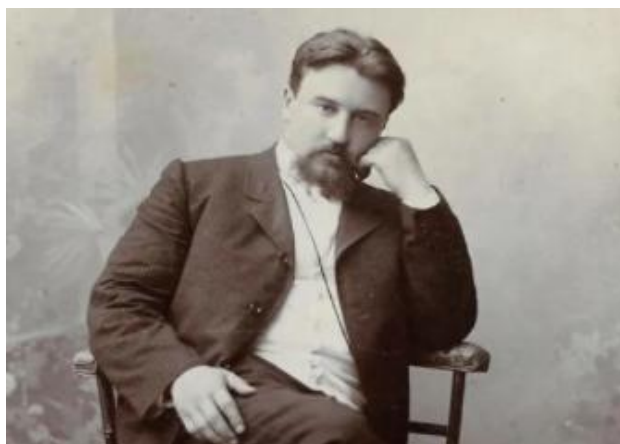
Куприн А.И. (1870-1938)